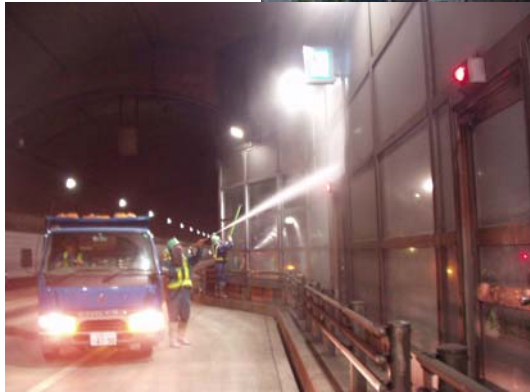
▲ 休山トンネル入口(上り線)