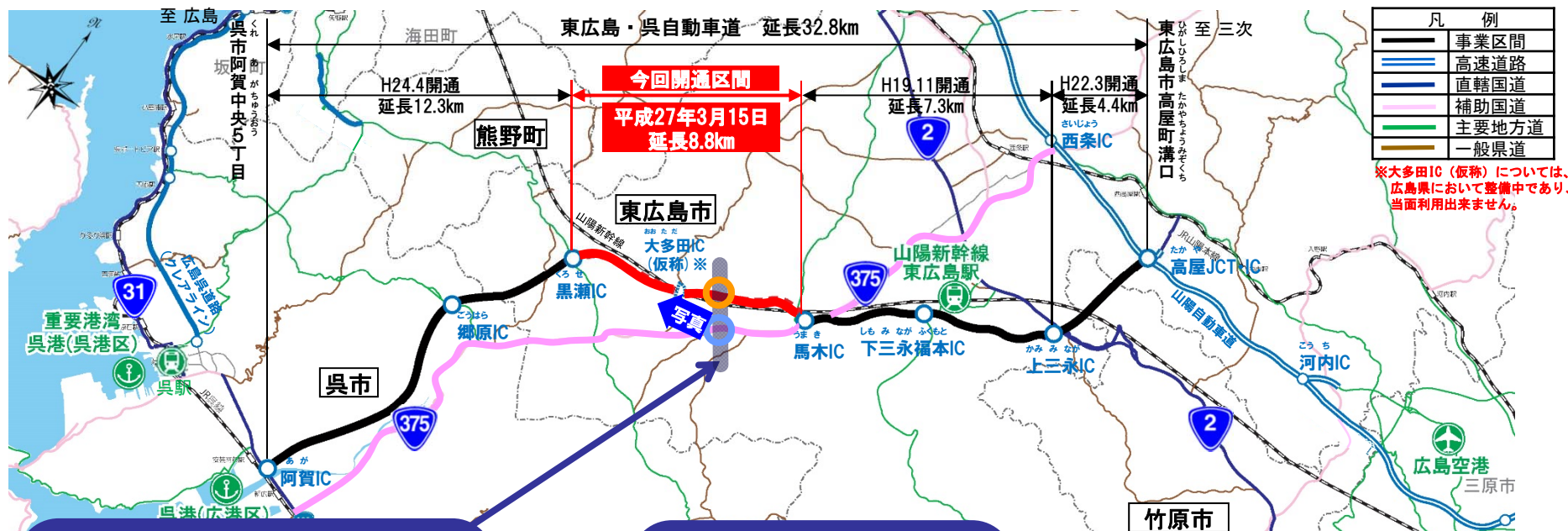
東広島・呉自動車道と一般国道375号の利用交通量(今回開通区間)