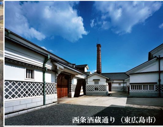
西条酒蔵通り (東広島市)