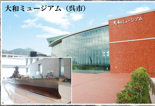
大和ミュージアム (呉市)