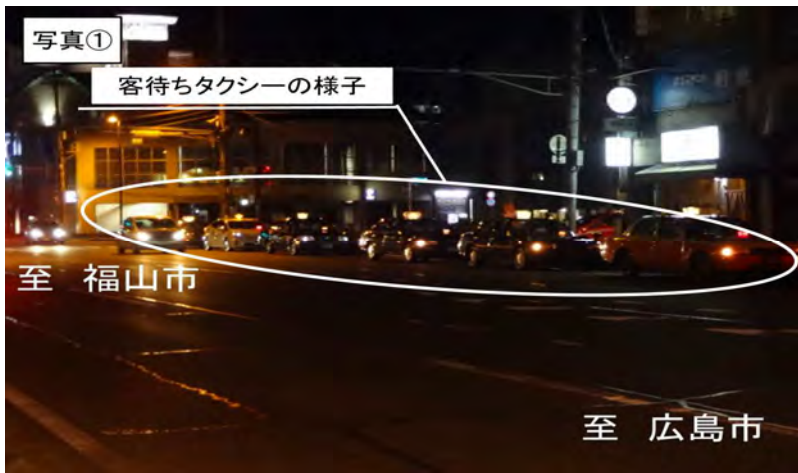
客待ちタクシーの待機状況