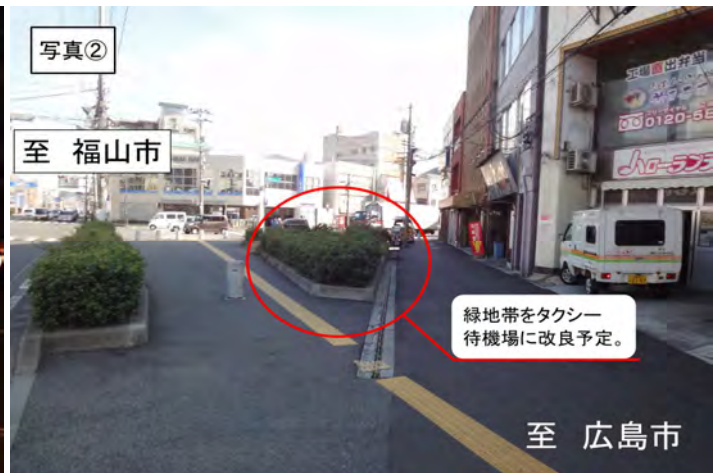
タクシー待機場整備予定箇所