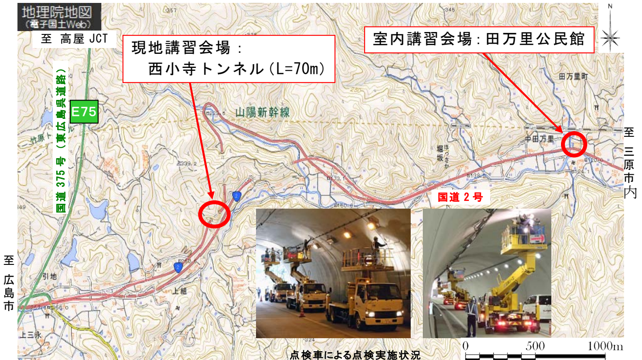
点検車による点検実施状況