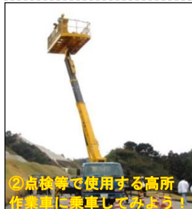
③点検等に使用する高所作業車に乗車してみよう！