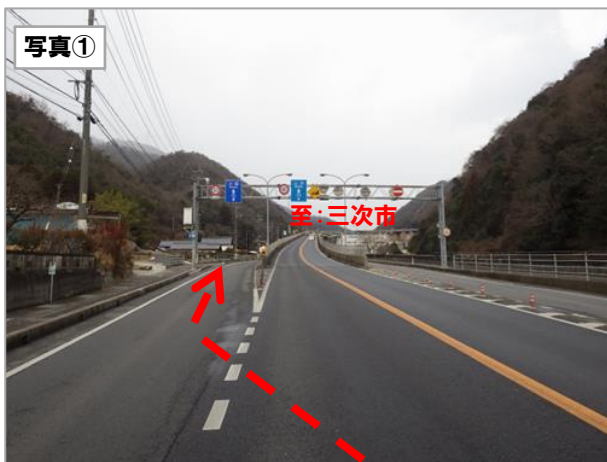
※上根バイパスに上がらず、側道へ進入して下さい。