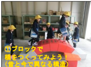
①ブロックで橋をつくってみよう！ (昔と今で異なる構造)