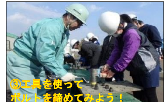
⑤工具を使ってボルトを締めてみよう！

※上記写真のような体験状況の取材が可能です。別紙の開催場所まで直接お越し下さい。