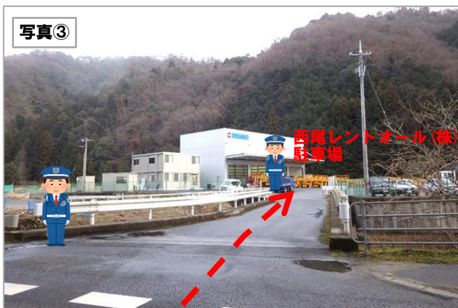
※右折後も、案内する人がいます。 橋を渡って、中へお入り下さい。