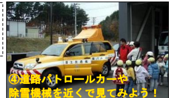
④道路パトロールカーや除雪機械を近くで見てみよう！