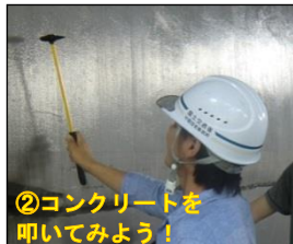
②コンクリートを叩いてみよう！