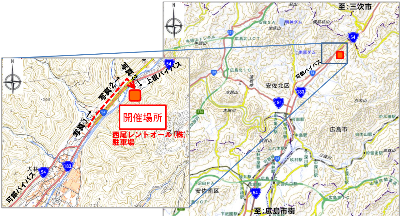
「地理院地図」をもとに、広島国道事務所作成

※国道54号 大林高架橋(上根バイパス)東側の西尾レントオール(株)の駐車場です。 住所：広島市安佐北区大林町字台 534-2