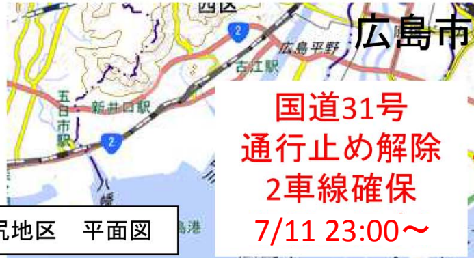
坂町水尻地区 平面図

特に朝夕など、渋滞の発生が予想されます。 相乗り等の交通量の抑制にご協力をお願いします。