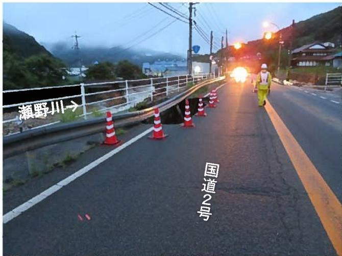
平成30年7月豪雨による被災状況