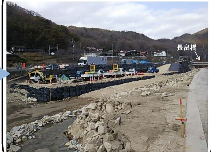
施工ヤード整備中