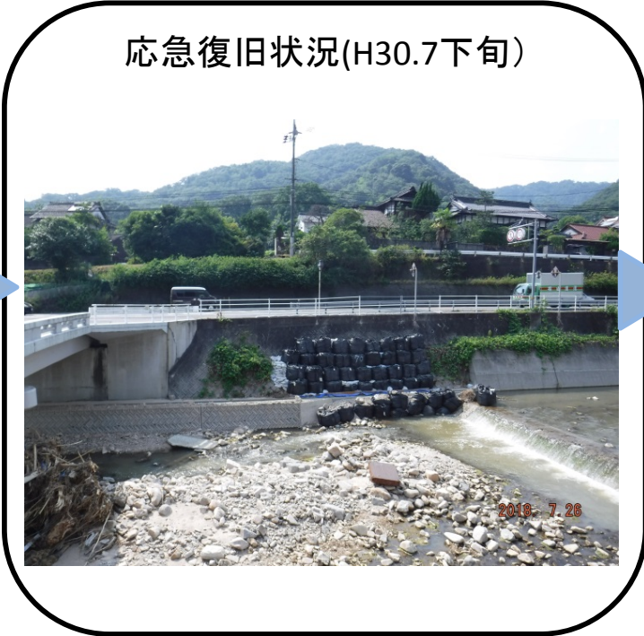
応急復旧状況(H30.7下旬)