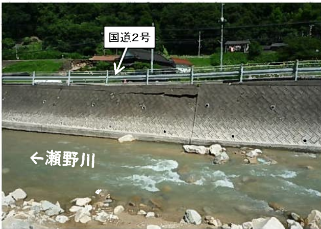
応急復旧状況(H30.7下旬)