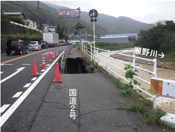
平成30年7月豪雨による被災状況