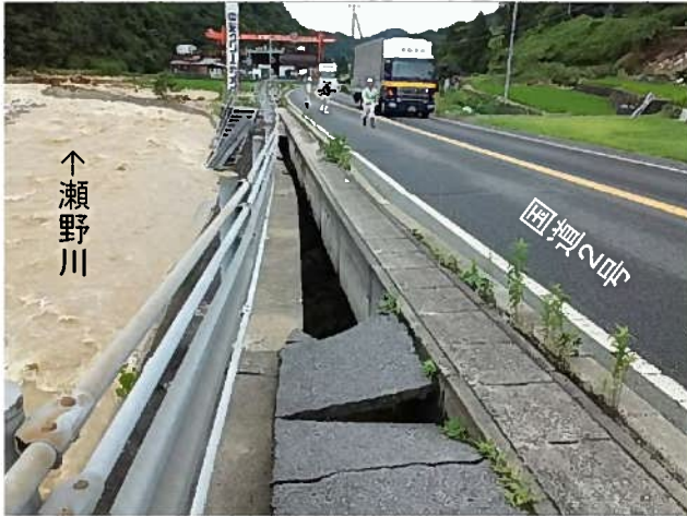
平成30年7月豪雨による被災状況