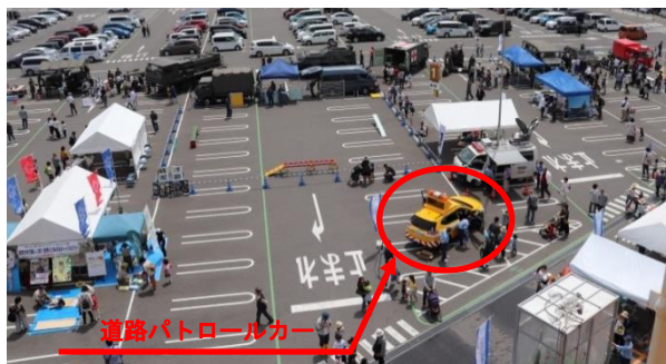
道路パトロールカーの展示状況