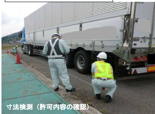
寸法検測(許可内容の確認)