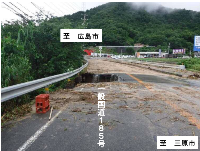
被災当時の状況（平成30年7月7日）