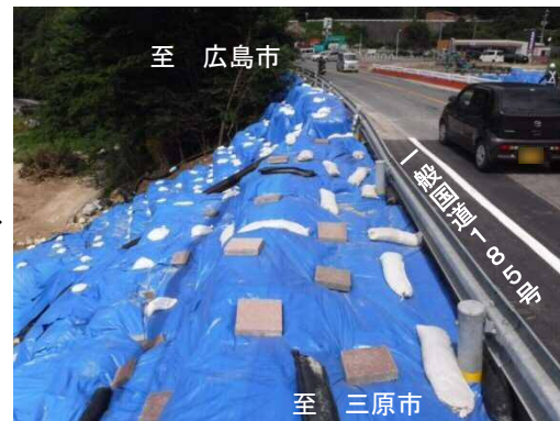
◇応急復旧時の状況