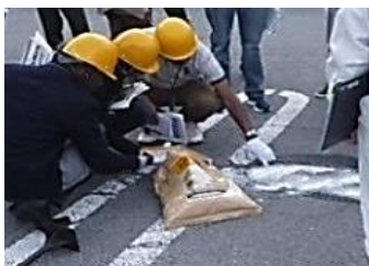
ポットホール補修実習