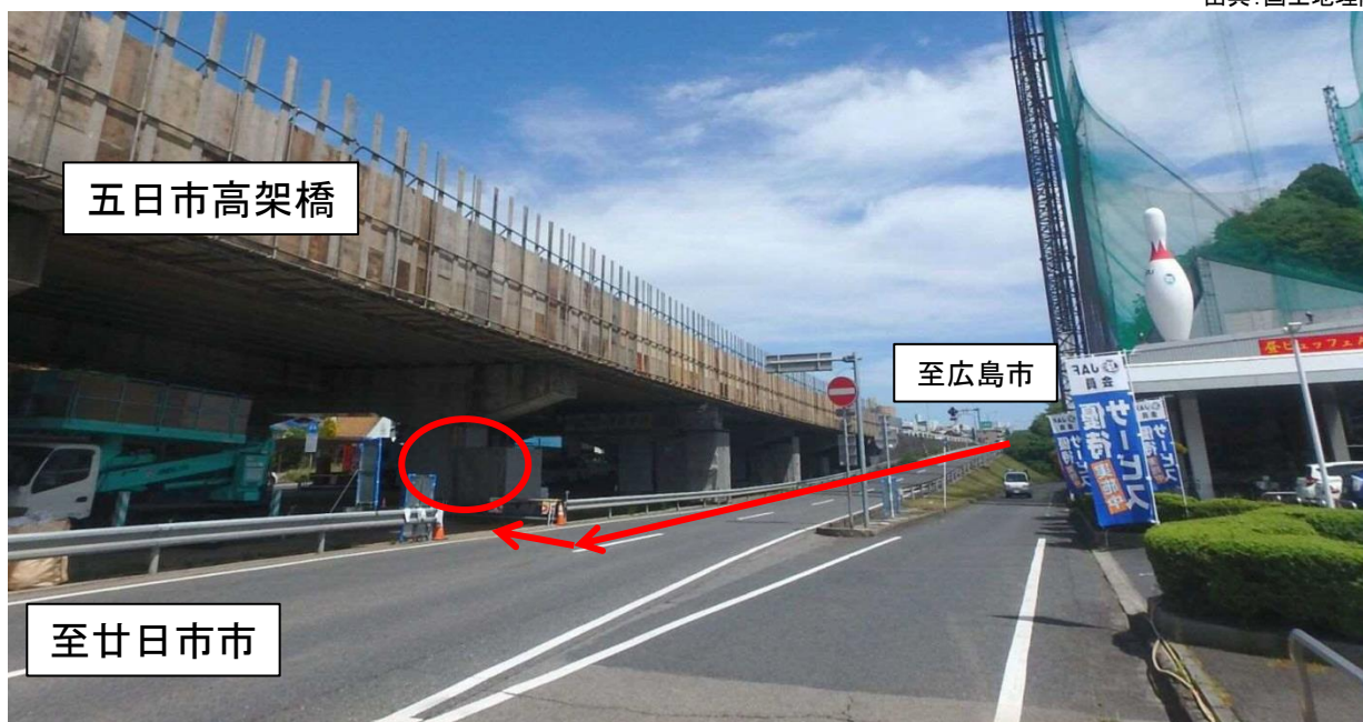
昨年度実施状況(橋梁補修実習)