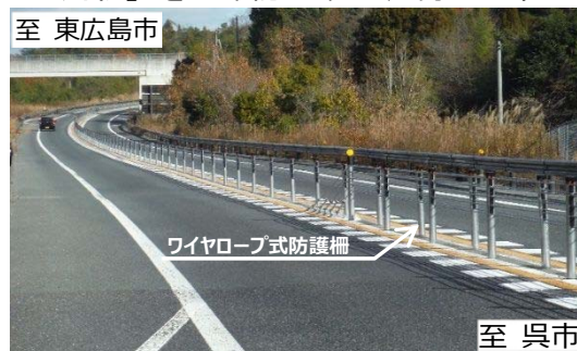
【E75】東広島・呉自動車道（馬木 IC～下三永福本 IC間）