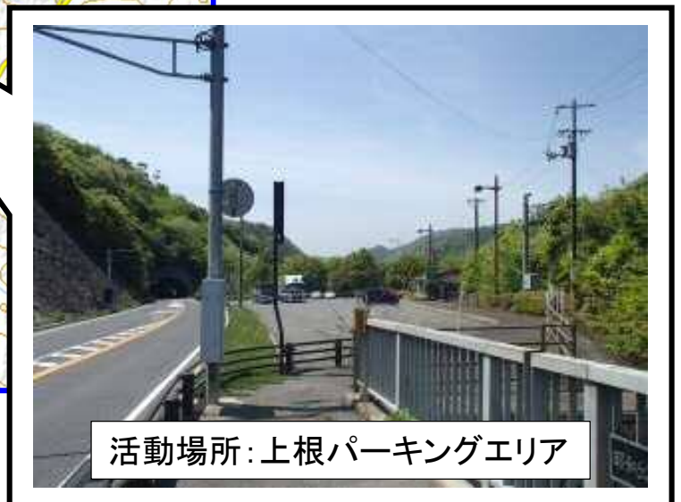
活動場所: 上根パーキングエリア