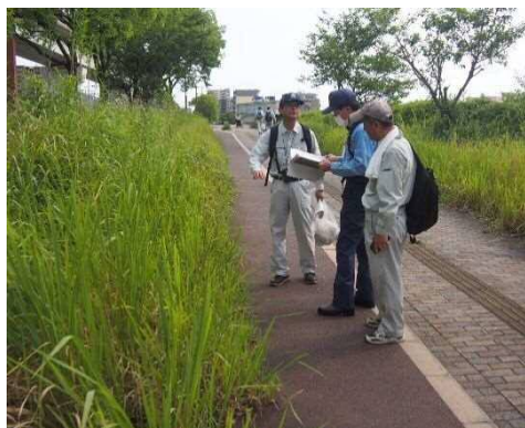
過年度実施状況（雑草繁茂状況）