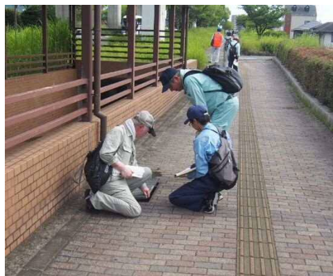
過年度実施状況（側溝蓋の点検）