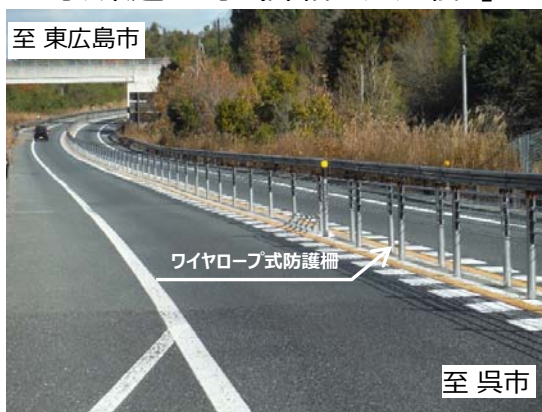
【E75】東広島・呉自動車道（馬木IC～下三永福本IC間）