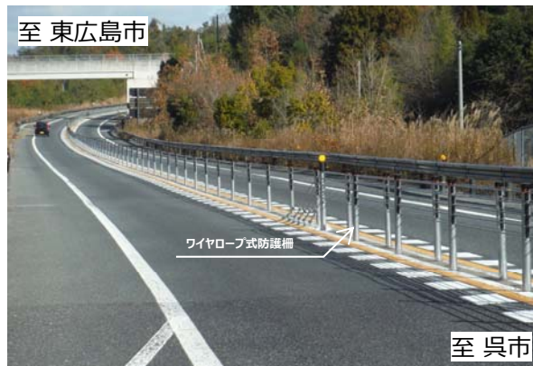
【E75】東広島・呉自動車道(馬木IC～高屋JCT・IC間)