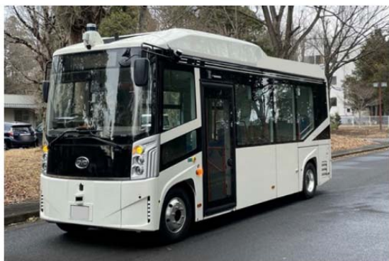
▲実験予定車両（EVバス）