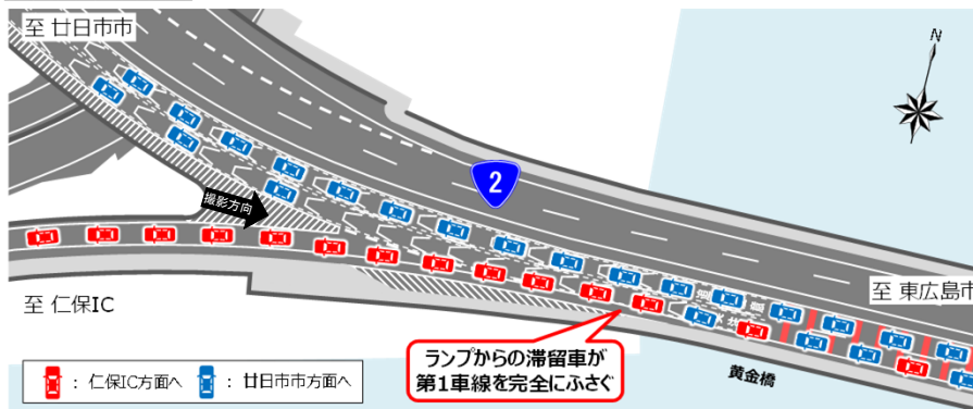
位置図・阻害状況