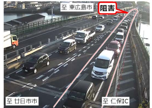
【写真】国道2号仁保地区の交通状況

…→ 仁保地区の詳細な渋滞対策の内容（区間・構造等）は次ページをご参照ください。