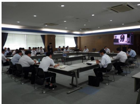
▲会議状況（広島県道路メンテナンス会議） 令和5年9月11日

【事務局】広島国道事務所、中国道路メンテナンスセンター、広島県、広島市、西日本高速道路(株)