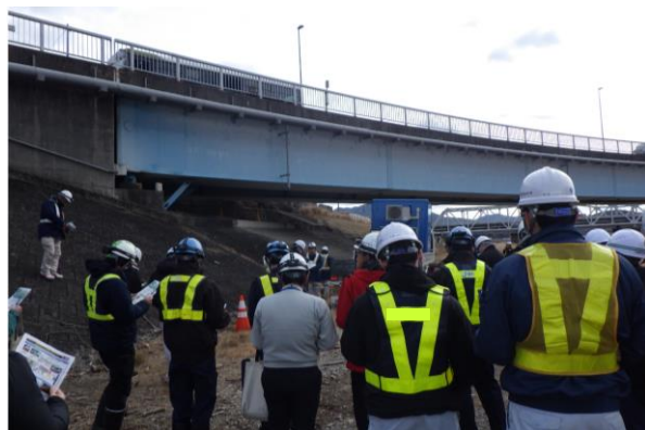
▲技術支援 （令和5年度点検支援技術見学会の状況）