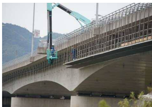
《足場架設作業イメージ》