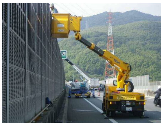
《落下物防護柵設置作業イメージ》