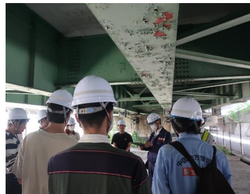
写真:令和5年6月の現場実習の状況(橋梁等点検)