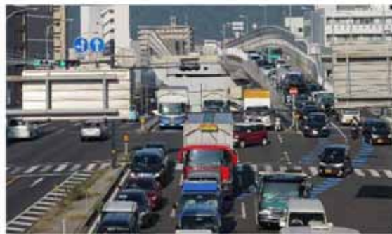
【写真②】新観音橋東詰交差点の状況（岩国方面を望む）