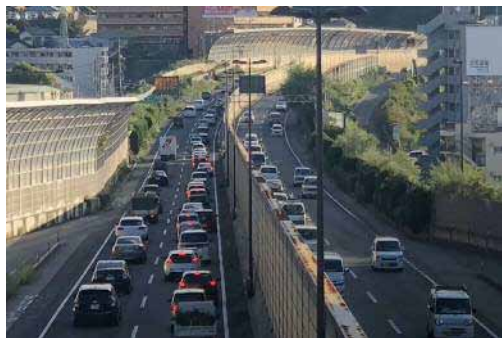
【写真①】高須付近の状況（広島方面を望む）