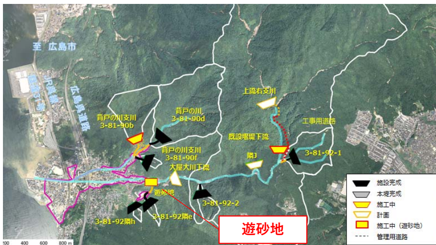
遊砂地完成イメージ図