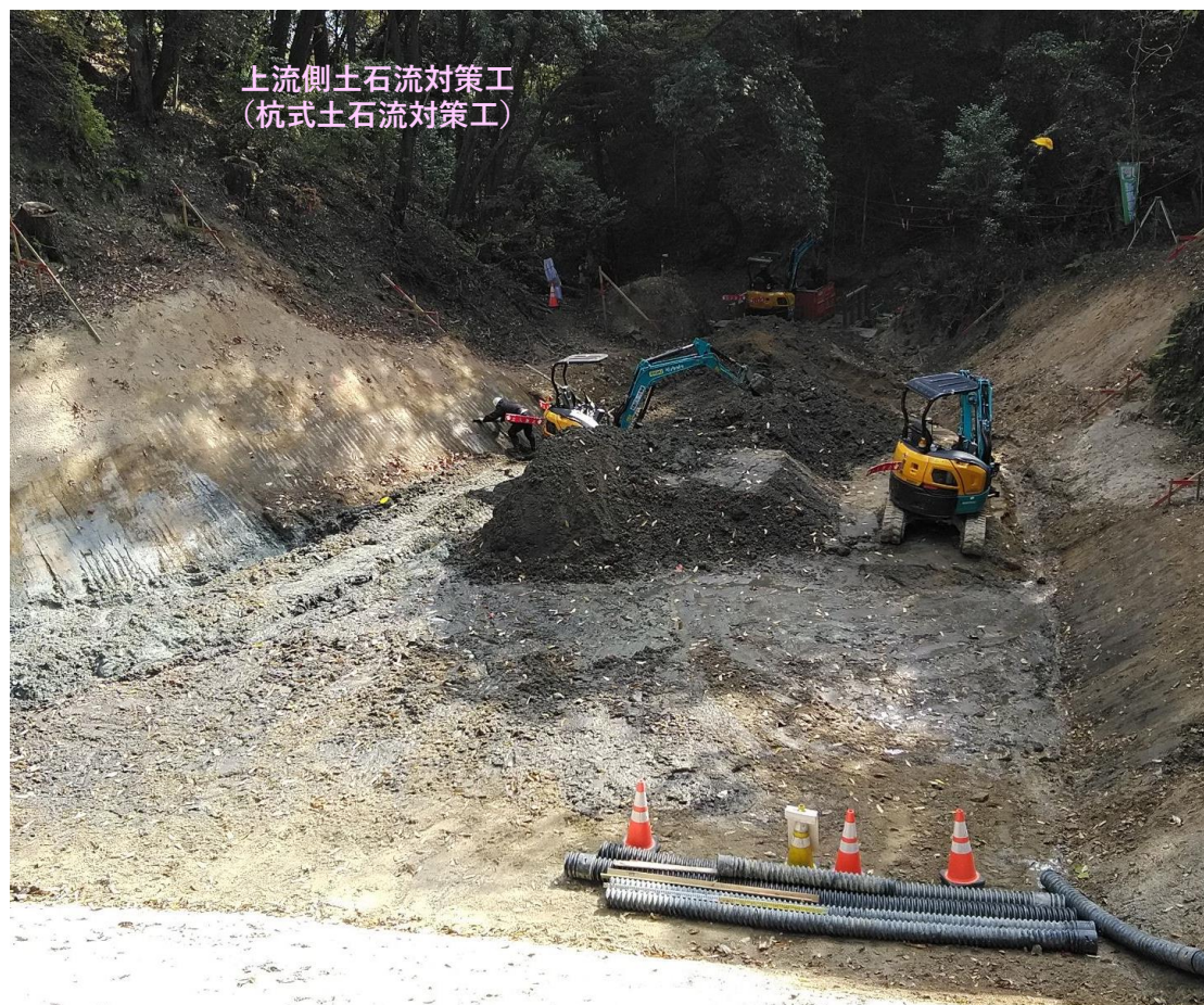
【施工状況（御幸川支川砂防堰堤上流側土石流対策工）】