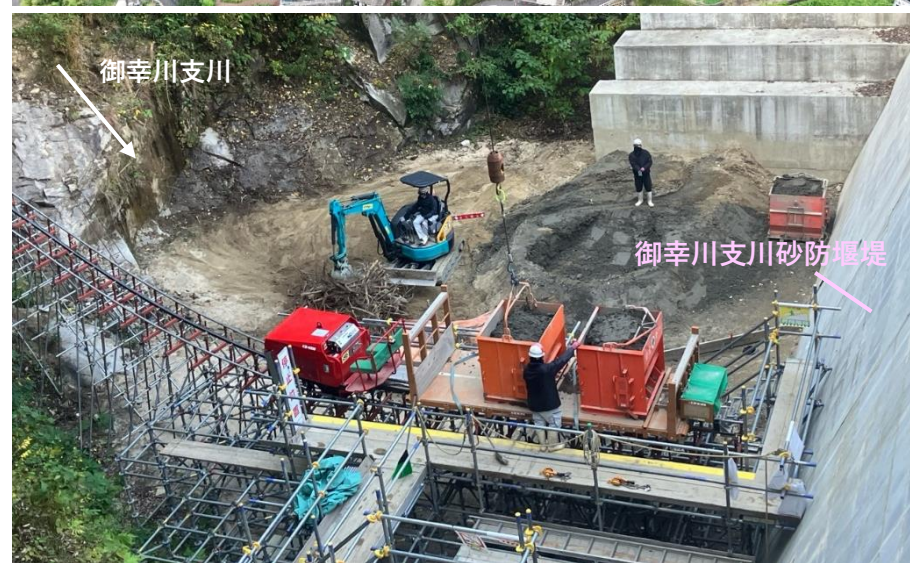
【施工状況（御幸川支川砂防堰堤上流）】