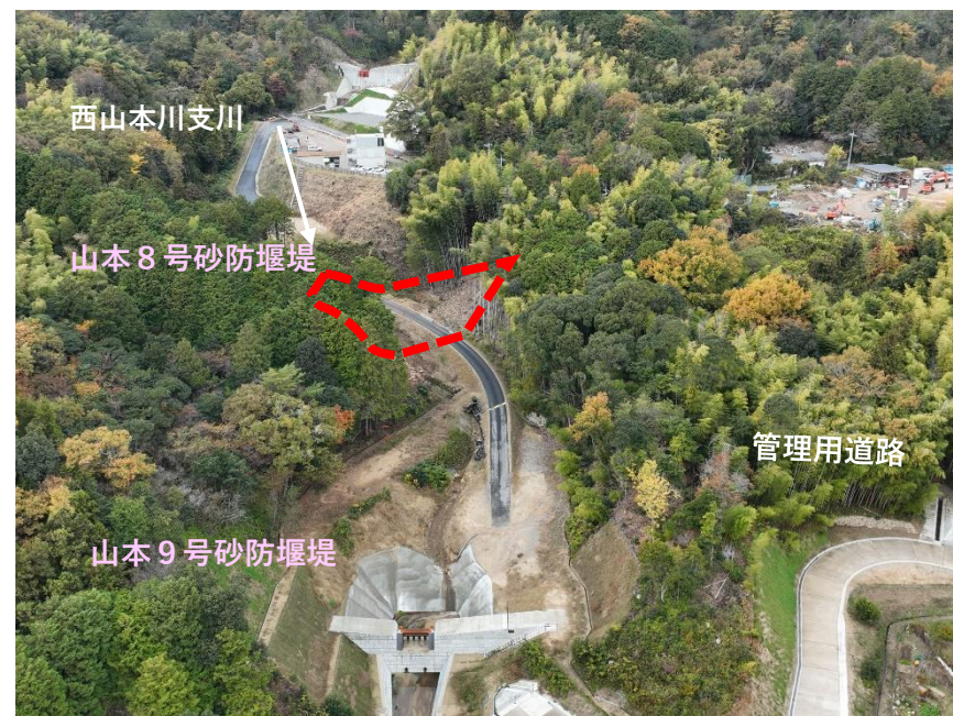
【 全 景 】