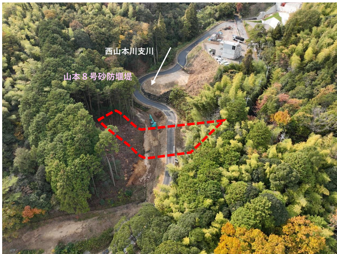
【 施工状況 】