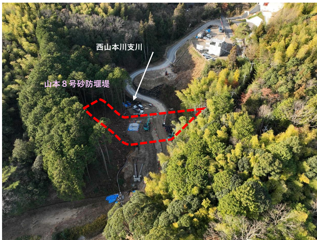
【 施工状況 】