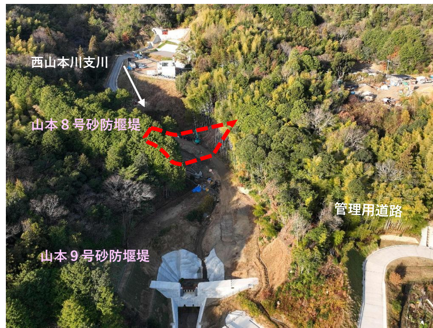
【 全 景 】