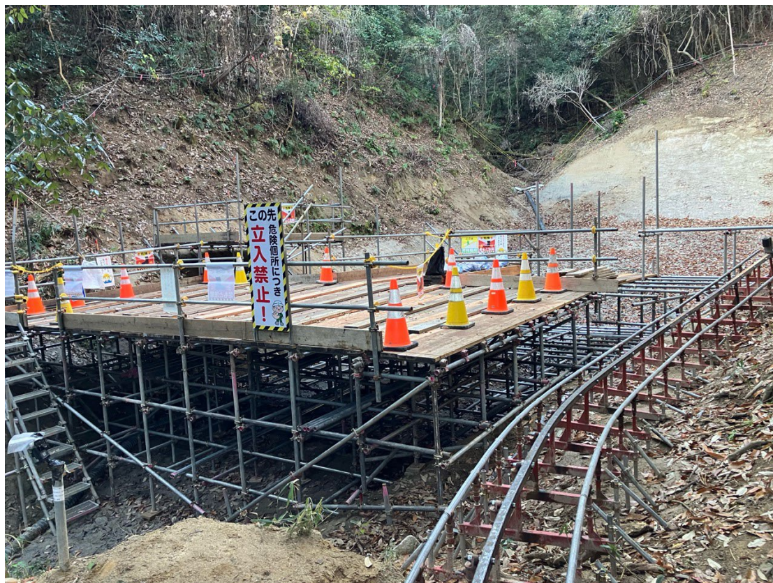
【施工状況：対策工施工のための準備工】 (御幸川支川砂防堰堤上流側土石流対策工)