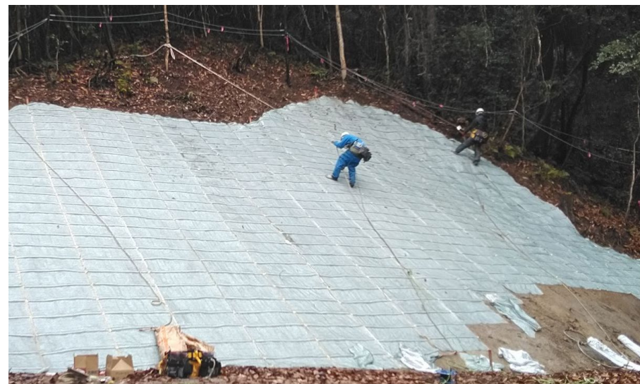
【施工状況：法面工】 (御幸川支川砂防堰堤上流側土石流対策工)