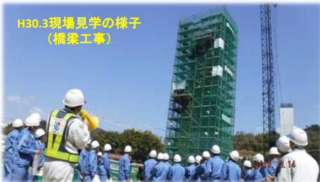
H30.3現場見学の様子 (橋梁工事)