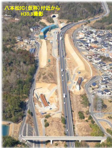
八本松IC(仮称)付近から H30.3撮影