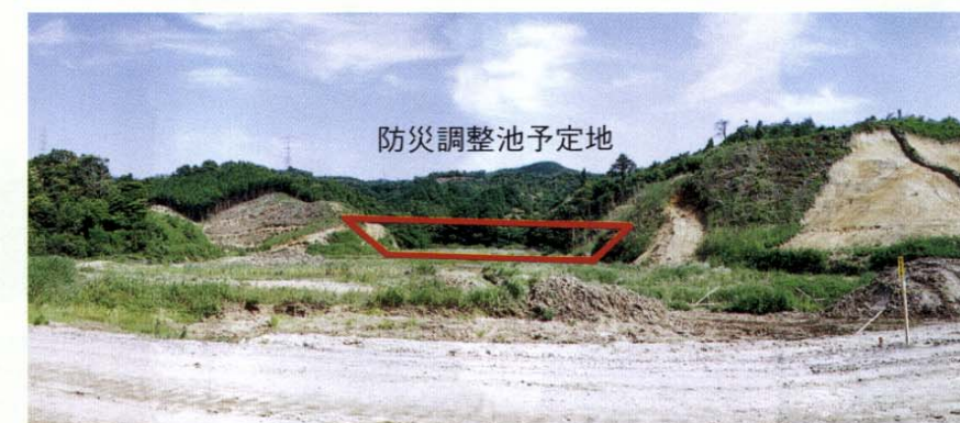
防災調整池予定地

残土処理を行うための準備工事である工事用道路がほぼ完成し、引き続き防災調整池工事を行っています。また、残土処理の際に流出する濁水を処理する施設の工事も同時に進めています。