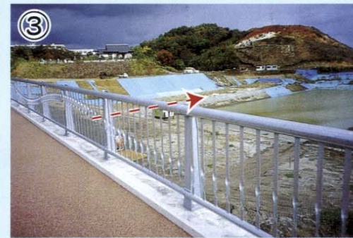
③ 半分大橋右岸付近