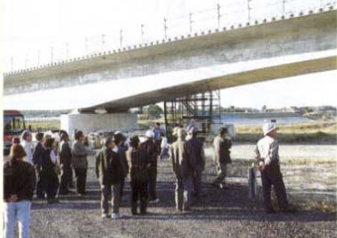
新崎屋橋見学風景

見学会を行った十一月十四日は晴天に恵まれ、また休日ということもあり総勢約八十名の方々の参加がありました。参加した方の多くは毎年見学会に参加されており、事業の進み具合についての関心も高く、現場の説明を熱心に聞き入っておられました。