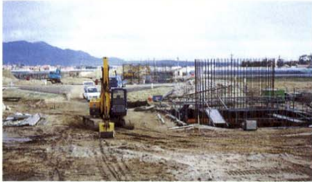
くにびき海岸大橋