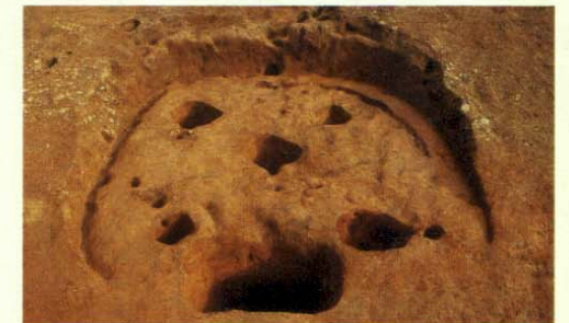
▲弥生時代後期の竪穴建物跡

長廻遺跡は、標高40mの小高い丘にあります。この遺跡からは、弥生時代後期～古墳時代後期(約1900～1400年前)にかけての竪穴建物跡が数棟確認されました。当時、この辺りに集落があったと考えられます。 これまでに、低地での弥生時代の集落遺跡はいくつか発見されていますが、丘陵地で発見されたのは初めての事です。