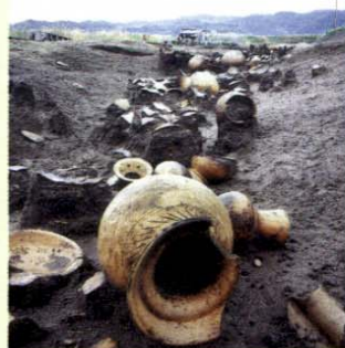
▲大溝から出土した大量の土器

弥生時代の環濠跡とみられる大溝が発見されました。この溝からは、弥生時代後期～古墳時代前期(約2000～1800年前)のものと思われる大量の土器が出土しています。 また、7世紀前半代の大型の掘立柱建物跡が見つかり、古志本郷遺跡における弥生村の成立や、古代役所の成立がうかがい知れる貴重な資料の発見となりました。