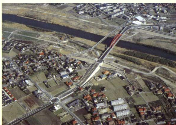
＜斐伊川放水路古志堤脚水路他工事＞