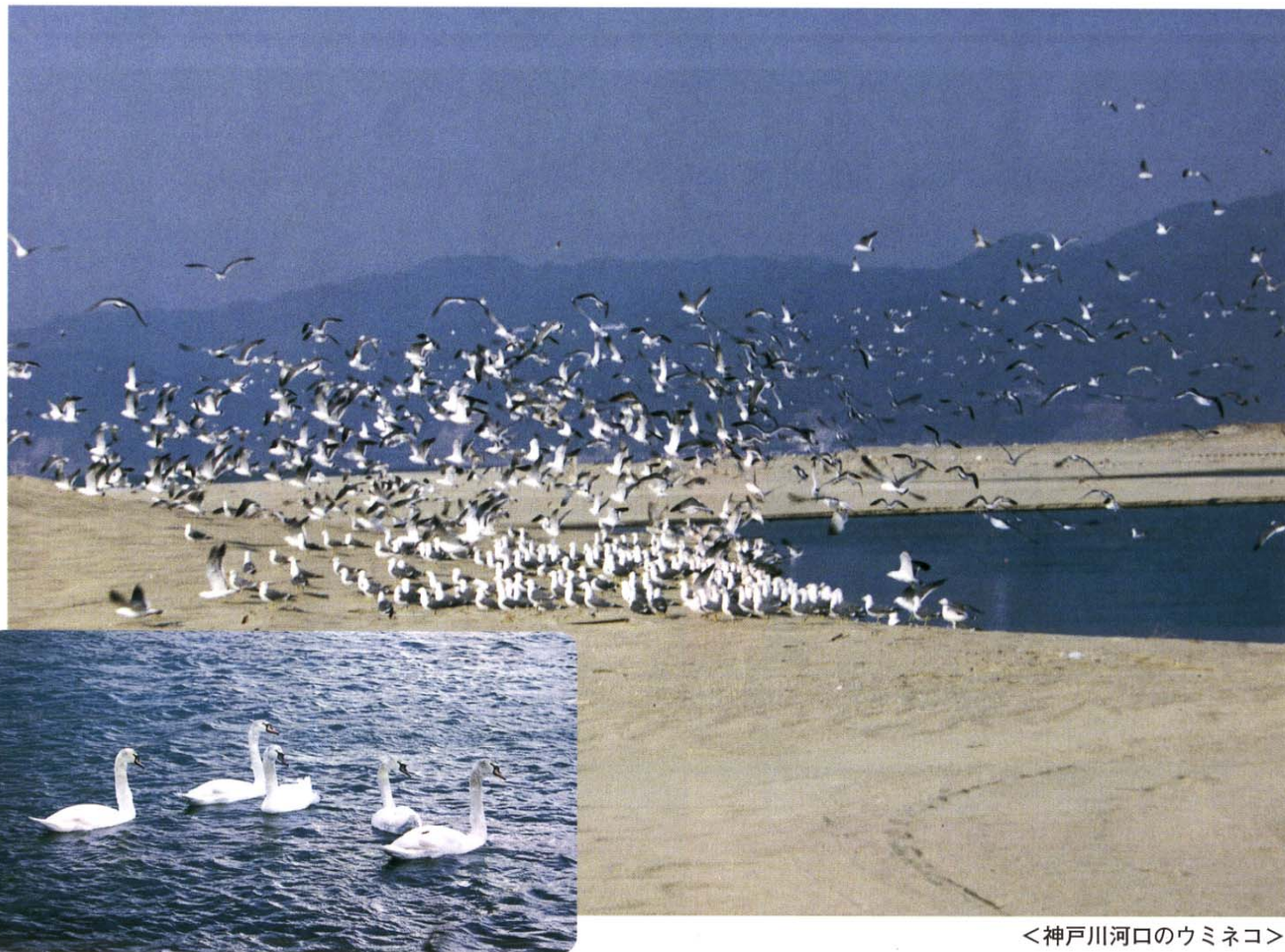
<神戸川河口のウミネコ>