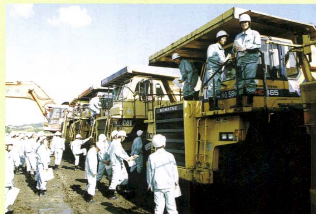
松江工業高校のみなさん＜開削部にて＞