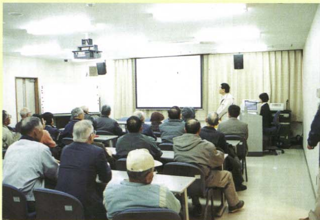
＜放水路ふれあいセンターにて＞

土木の日(11月18日)のイベントとして、一般の方々を対象とした見学会を開催しています。