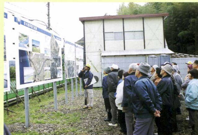
＜開削部:大津町上来原にて＞

土木の日(11月18日)のイベントとして、一般の方々を対象とした見学会を開催しています。