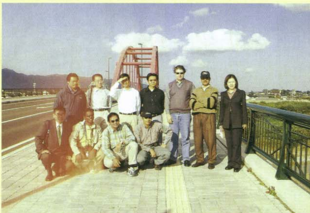
JICAのみなさん＜古志大橋にて＞