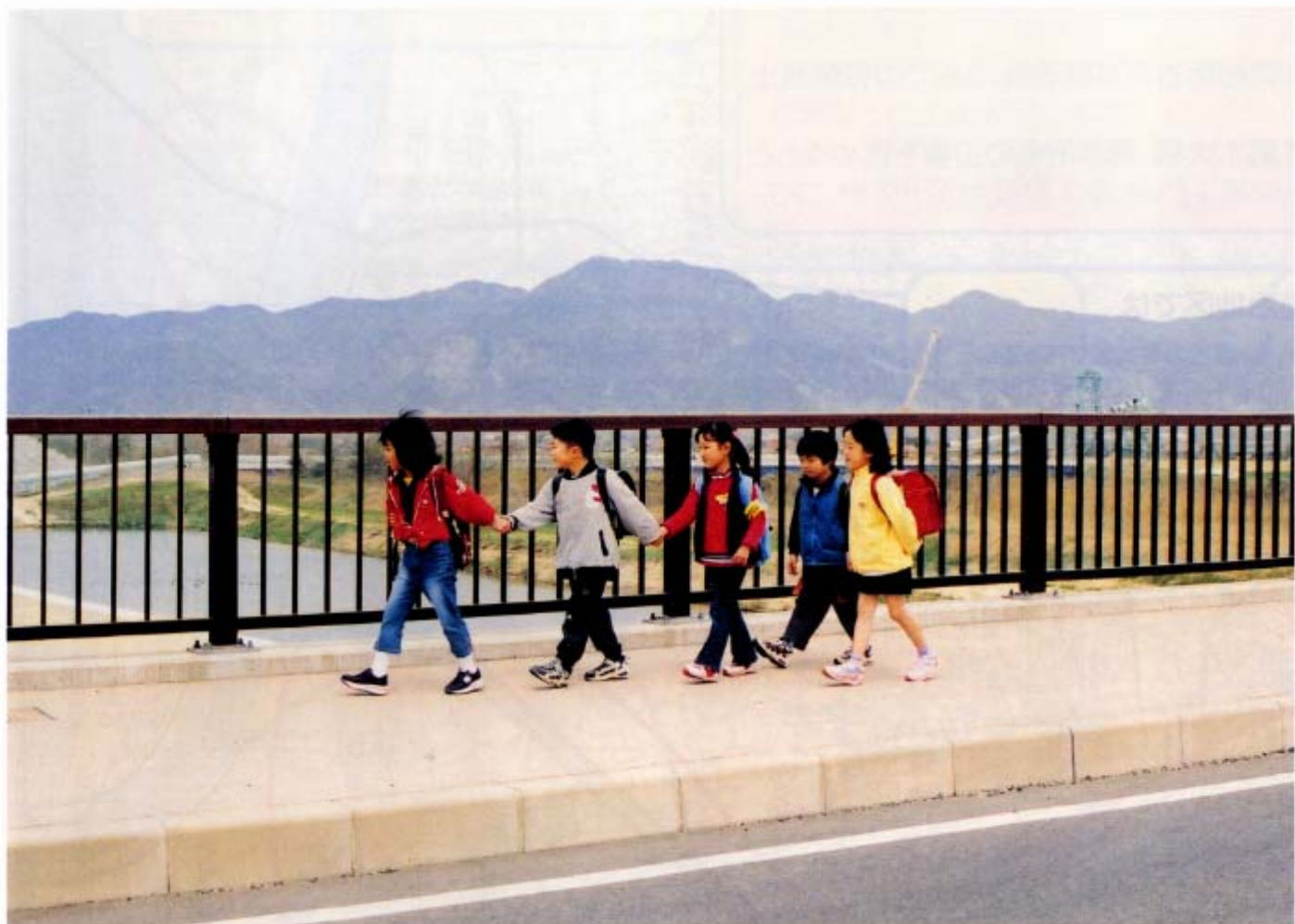
〈新崎屋橋を渡る長浜小学校児童〉