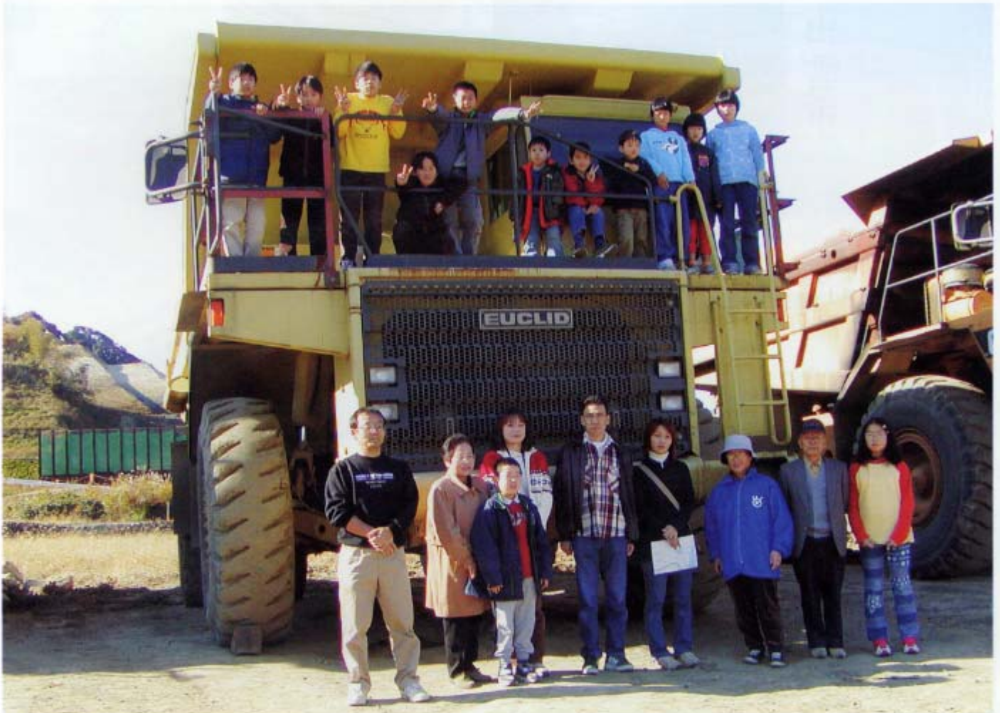
(60t積重ダンプで記念撮影)