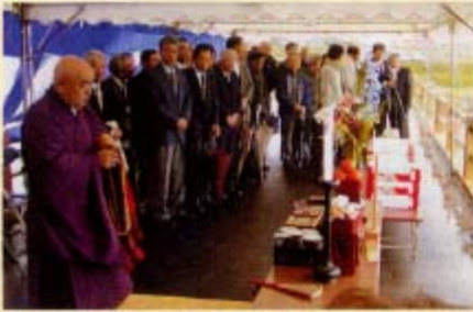
▲崎屋橋での式典の様様

現地では、渡り納めや読経が行われ、長年に渡り地域の生活、発展に貢献してきた二つの橋に、地元住民の方々は感謝しつつ別れを惜しんでいらつしやいました。