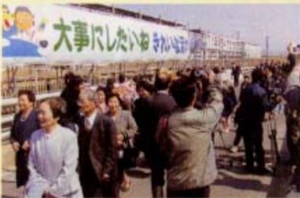
▲古志橋での渡り納めの様様