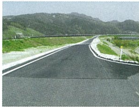
馬木新大橋上流の小段道路

この区間の開通により、新崎屋橋から下流側の右岸は河口まで、古志大橋から上流側の左岸が通行可能となりました。