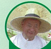
横浜国立大学 名誉教授 宮脇 昭先生

[参加団体] 塩冶小4年生,神戸川小4年生,高浜小4年生,朝山小4-5-6年生,稗原小5-6年生,荒木小6年生,一般参加者