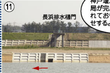
11 長浜排水樋門 長浜排水樋門工事が完了しました。

神戸堰から放流を行う際の警報局が完成。約800m毎に設置されており、危険を周囲にお知らせするよ。