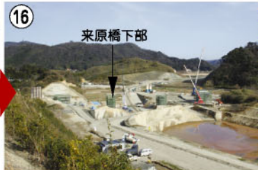
16 来原橋下部 来原橋下部工事が完了しました。