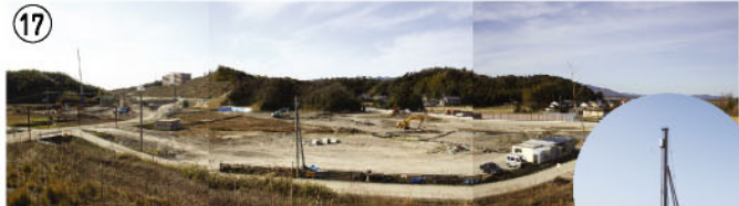
17 将来の堤防下の地盤改良工事が進捗しました。