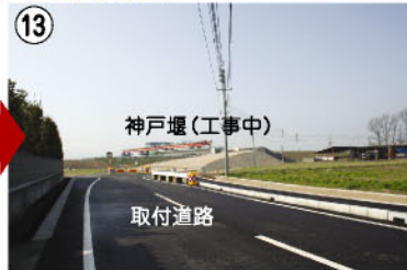
13 神戸堰(工事中) 取付道路 神戸堰取付道路の一部が完成しました。