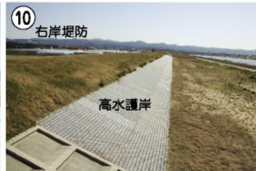
10 右岸堤防 高水護岸 高水護岸工事が完了しました。(新崎屋橋上流)