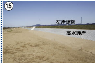
15 左岸堤防 高水護岸 高水護岸工事が完了しました。(境橋上流)