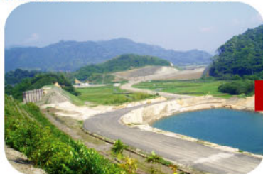
地盤改良工事、来原橋工事前の様子。