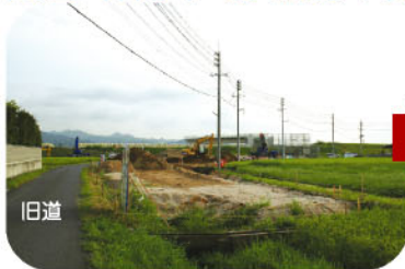
旧道 神戸堰取付道路工事中の様子。