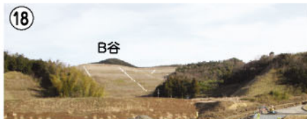
18 B谷 残土処理場(B谷)の盛土高も高くなってきました。