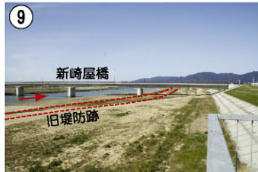
9 新崎屋橋 旧堤防跡 旧堤防を撤去しました。