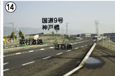
14 国道9号 神戸橋 取付道路 迂回路 神戸橋左岸取付道路迂回路が完成しました。