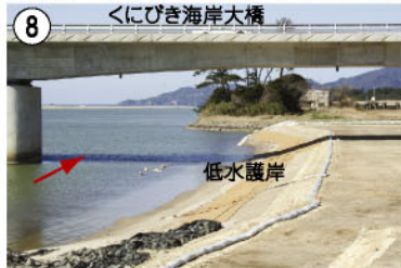
8 くにびき海岸大橋 低水護岸 低水護岸工事が完了しました。