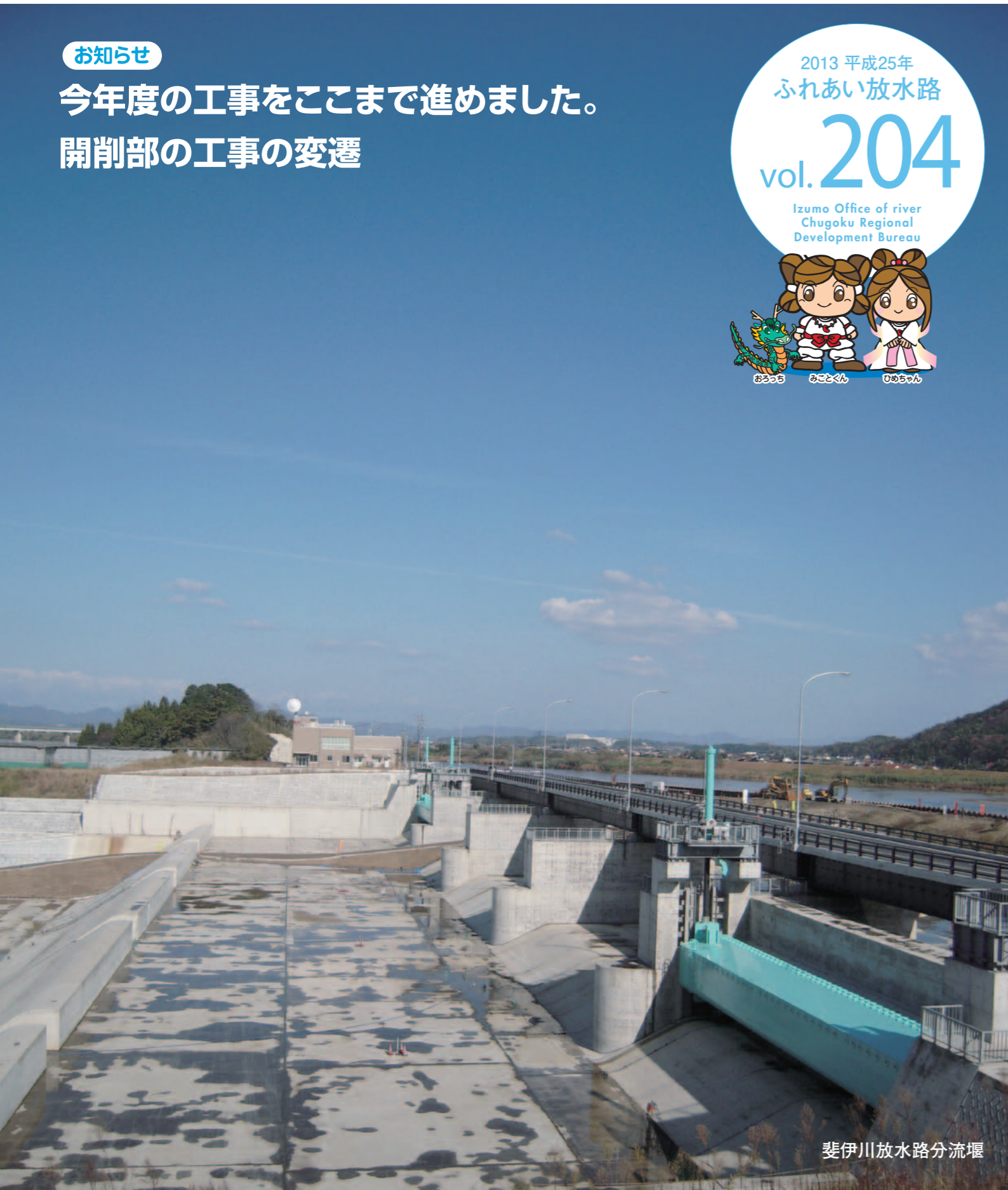
斐伊川放水路分流堰