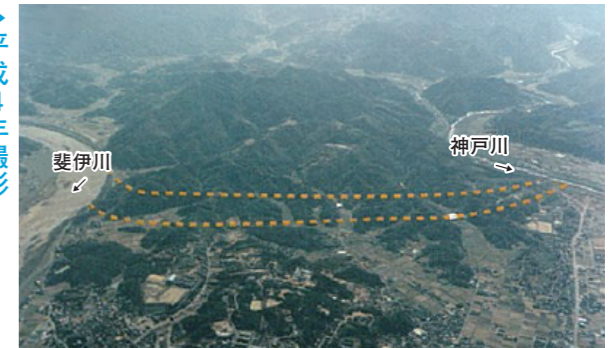
4.1kmにわたる開削部は、丘陵地だった箇所を掘削して建設しました。膨大な量の土砂を処理するため、工事用道路を建設した後、平成8年より本格的な掘削工事を始めました。