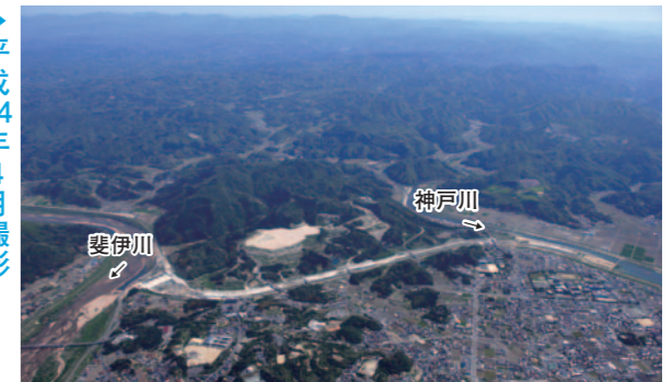
開削部では兩岸をつなぐ6本の橋梁を建設しました。平成22年度から始まった河床保護工事を経て、開削部の全体像もはっきり見えるようになりました。