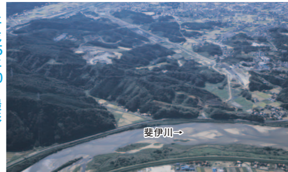
施工前の様子。この後平成20年度に分流堰建設のため県道の迂回路を設置し、翌年度より掘削・本体工事を始めました。