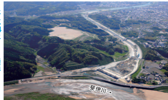
分流堰工事では45万m 3 の土砂掘削を行い、3.6万m 3 のコンクリート工を施工しました。平成23年度末には本体が完成しています。