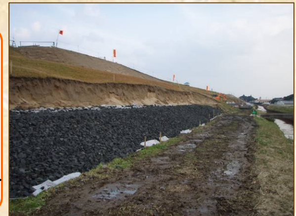
ドレーン工施工状況