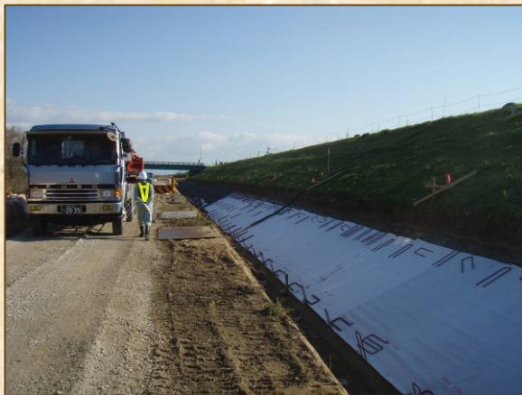
遮水シート施工状況

現在、工事は本格的な施工に入っており、原鹿地区は2月末の完成、今在家地区は3月末の完成を目標に工事を進めております。