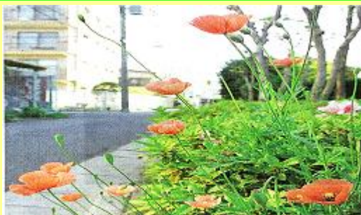
例えば、外来種ナガミナゲシを発見！！