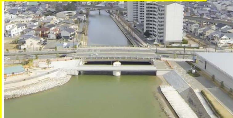
天神川水門(平成27年1月完成)