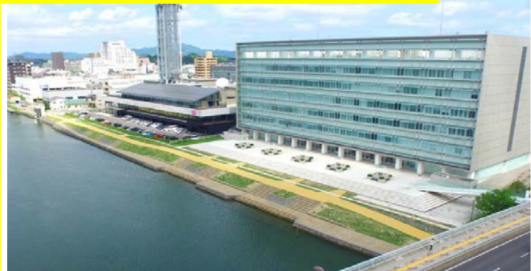
向島地区(平成30年3月概成)