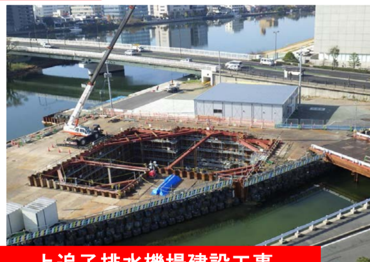
上追子排水機場建設工事