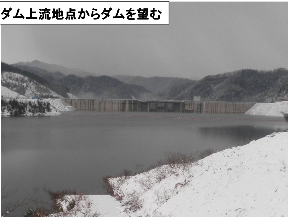
ダム上流地点からダムを望む