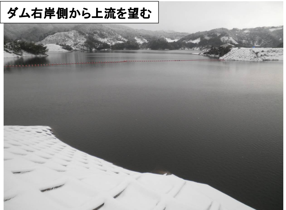
ダム右岸側から上流を望む