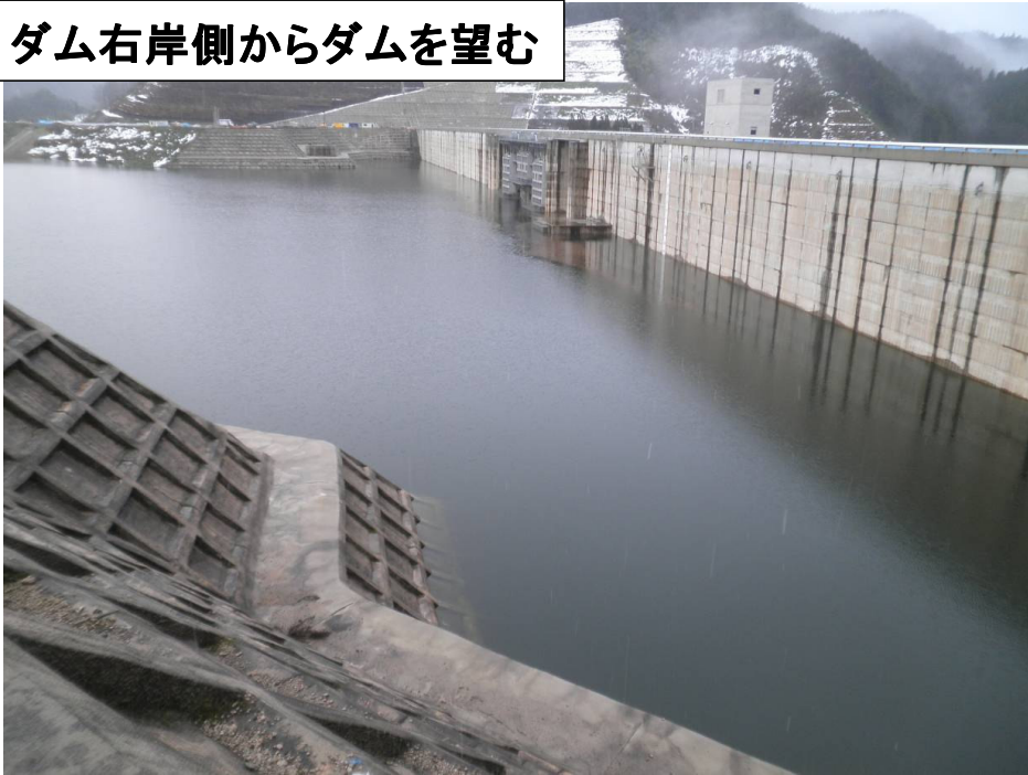
ダム右岸側からダムを望む