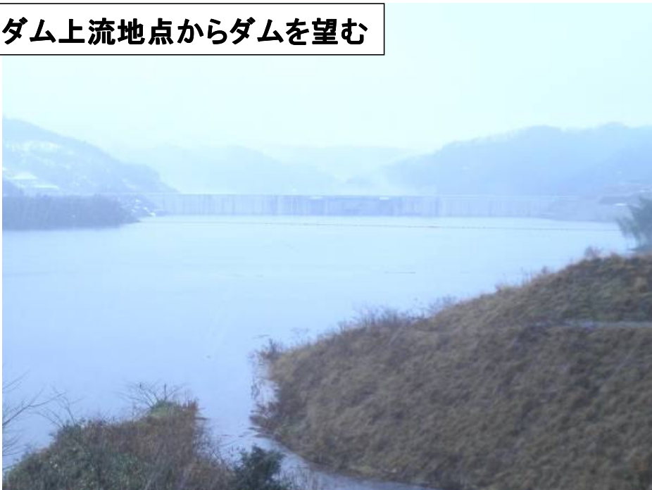
ダム上流地点からダムを望む