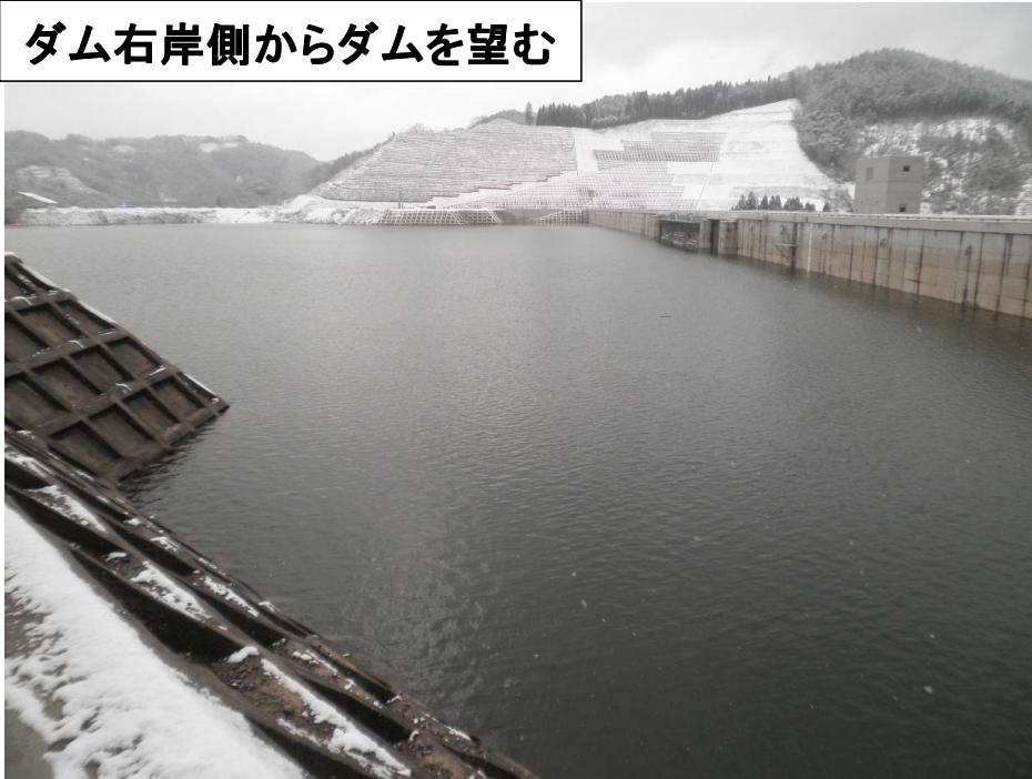
ダム右岸側からダムを望む