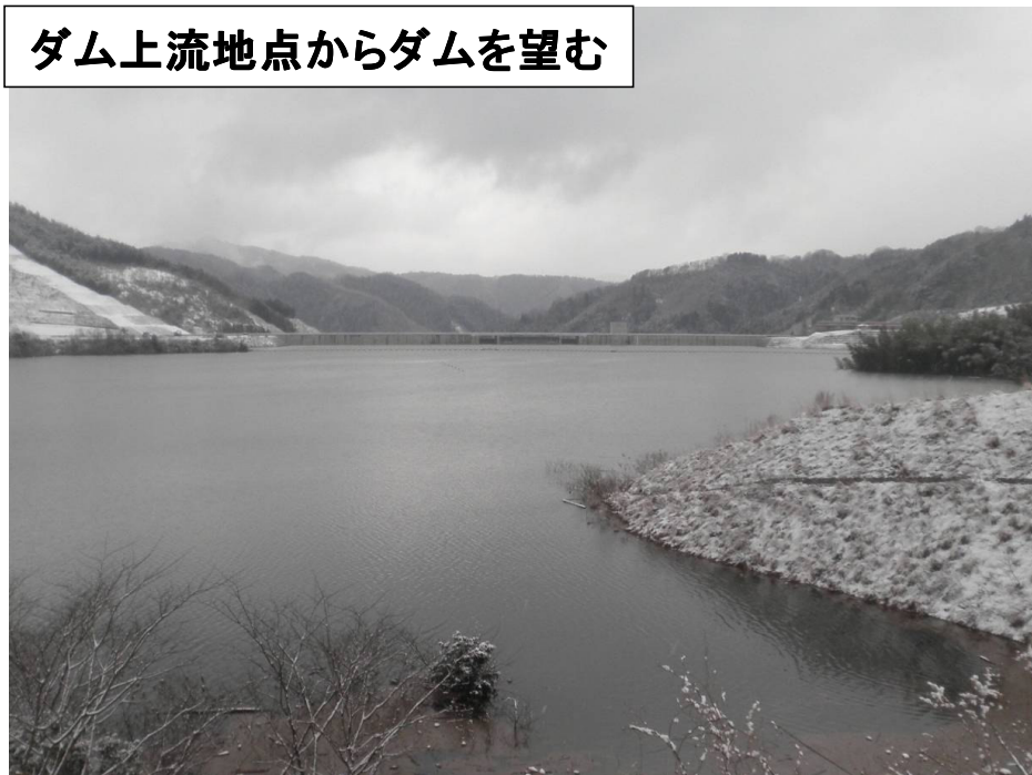
ダム上流地点からダムを望む