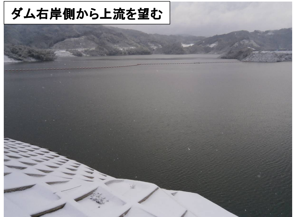
ダム右岸側から上流を望む