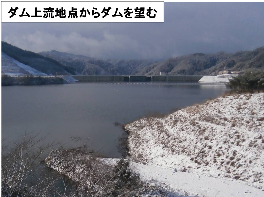
ダム上流地点からダムを望む