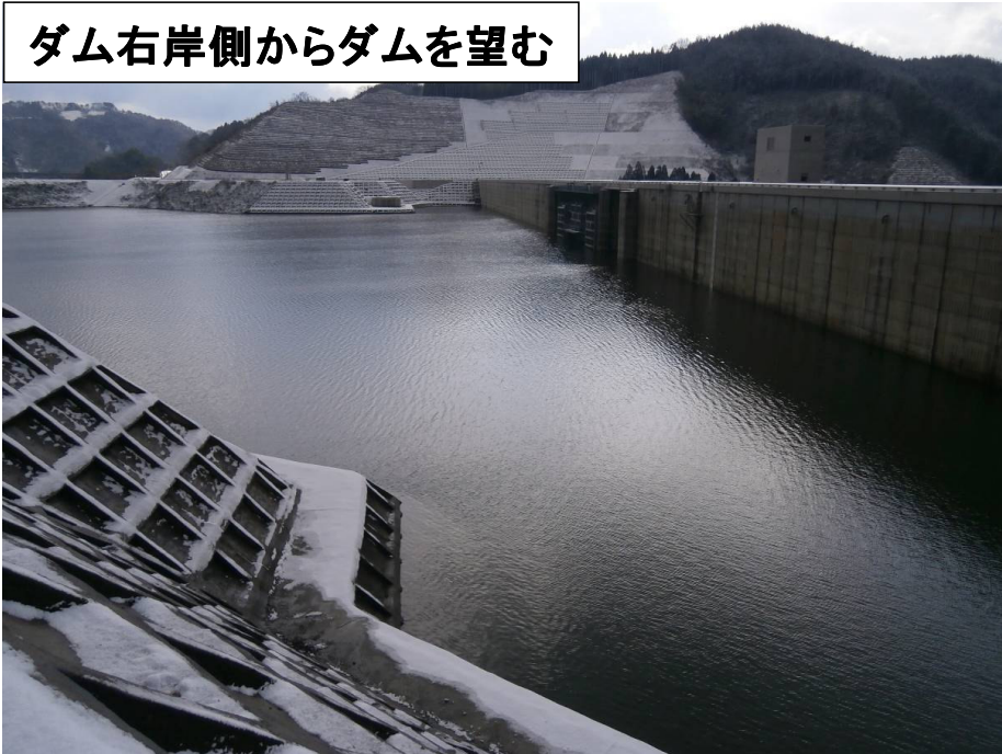
ダム右岸側からダムを望む