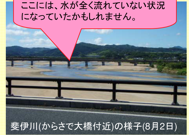
斐伊川(からさで大橋付近)の様子(8月2日)

もし、尾原ダムがなかったら…… ここには、水が全く流れていない状況になっていたかもしれません。