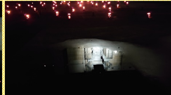
← さくらおろち湖の 名前の由来となっ ている桜をモチフ にした竹灯籠