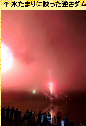
↑ 水たまりに映った逆さダム