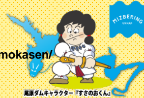
尾原ダムキャラクター「すさのおくん」