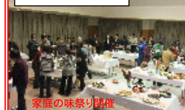
食文化伝承レシピ