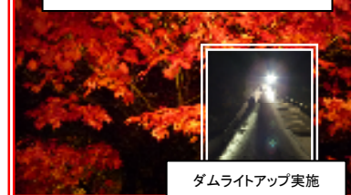
彩りの森の紅葉をライトアップ