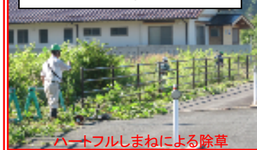
河川と道路の景観保全活動